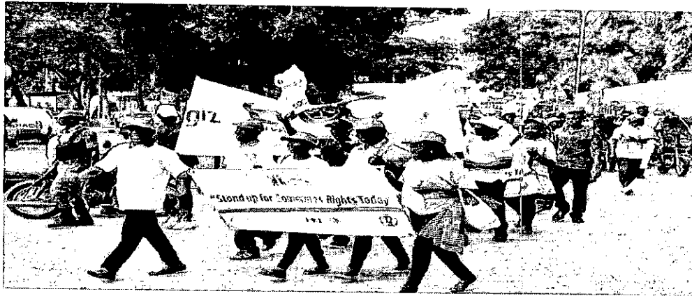
Uganda'da İnsan Hakları Günü Kutlamaları

Yıldönümünün etiketi #standup4humanrights . Bu etiket, diğerlerinin hakları için daha fazla özgürlük, daha güçlü saygı ve daha fazla şefkate yönelik insanları harekete geçirmeye çağıran BM İnsan Haklarını Savunma kampanyasına dayanmaktadır.